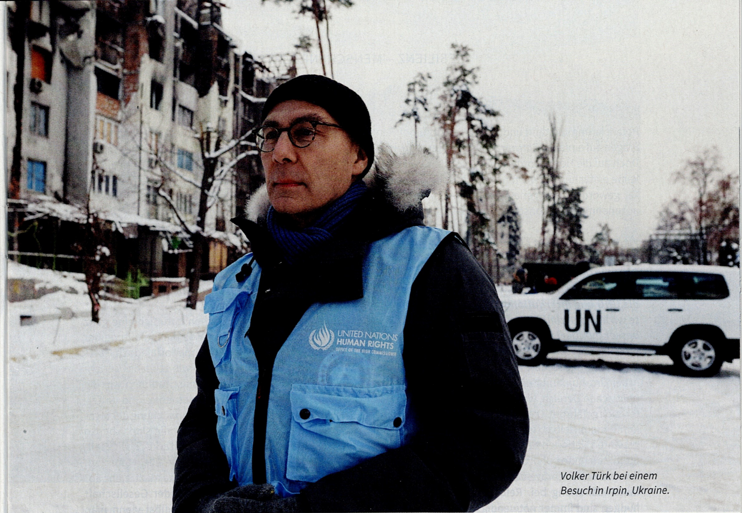
Volker Türk bei einem Besuch in Irpin, Ukraine.